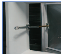
Mecanismo de apertura.

Disponible también en versión zócalo metálico.