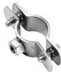
ABRAZADERAS AISI 304