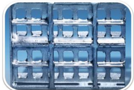
Entramado con malla seguridad 8x8